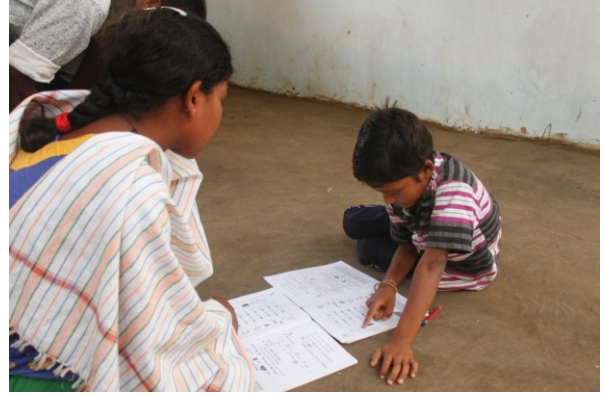
छोटे बच्चे को सिखाती बड़ी छात्रा

उद्योग का प्रशिक्षण ले रहे छात्रों की रोजाना मीटिंग होती है और महीने में एक बार उनकी प्रगति की समीक्षा की जाती है। विषय-वस्तु को लेकर उन्हें कुछ खास कुशलताएँ सिखाई जाती हैं। इन छात्र-शिक्षकों को छोटे बच्चों के साथ काम करने की खुली छूट दी जाती है।